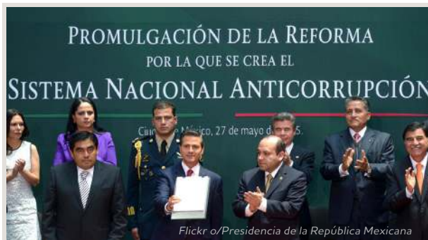
Presidente Enrique Peña Nieto promulga el Sistema Nacional Anticorrupción en la Ciudad de México (27 de mayo de 2015)

Aunque el gobierno del Presidente Enrique Peña Nieto no ha demostrado la voluntad política necesaria para lograr que este sistema sea eficaz (al haber intentado impedir el avance de varias importantes investigaciones contra la corrupción), el próximo gobierno mexicano podrá consolidar el marco existente. El grado en el que esto suceda, así como la medida en que el gobierno entrante se comprometa a implementar eficazmente la nueva Fiscalía General y a apoyar los esfuerzos anticorrupción a nivel estatal, serán claros indicadores de si México logrará al fin revertir la tendencia al aumento del número de casos de corrupción y colusión criminal que ha sacudido al país en los últimos años.