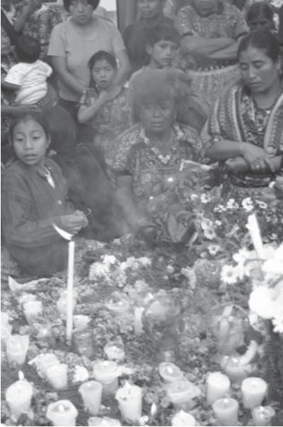
Memorial a las víctimas del conflicto armado interno en un antiguo destacamento militar y lugar de una exhumación en San Juan de Comalapa, Chimaltenango.

Las PAC formaron parte de un sistema alternativo de autoridad sobre y de control de la población dirigido por el ejército. Mucho de este sistema sigue aún intacto. Desde la firma de los Acuerdos de Paz, algunos comisionados militares y ex miembros de las PAC han asumido cargos de importancia a nivel municipal como alcaldes, miembros de los consejos locales, maestros, y policías. Aunque los Acuerdos mandaban hacer reformas militares, de inteligencia y policiales en las instituciones del estado, el “grupo con poder a nivel local generado por la contrainsurgencia nunca fue desplazado”. 93 Se presume que muchos de los comisionados militares y los ex miembros de