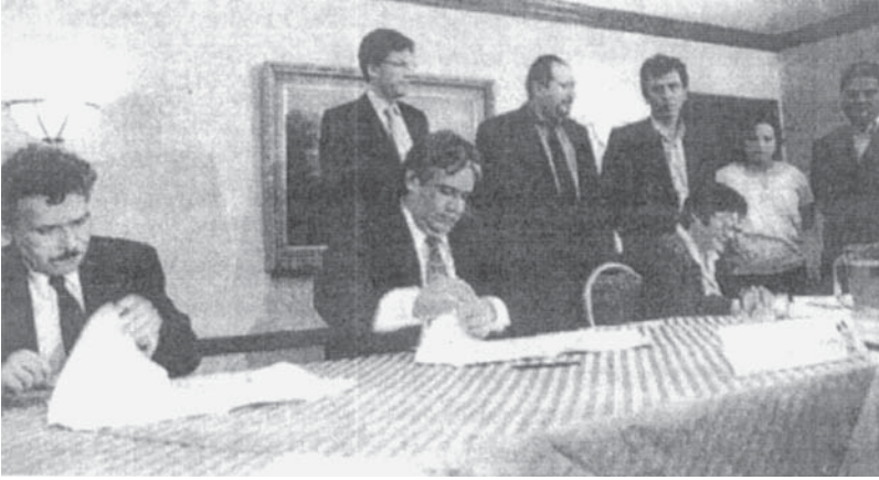
El 13 de marzo de 2003, el ministro de Relaciones Exteriores, el Procurador de Derechos Humanos y líderes de derechos humanos firmaron un acuerdo para el establecimiento de la CICIACS.

derechos humanos, personalidades nacionales y la comunidad internacional.