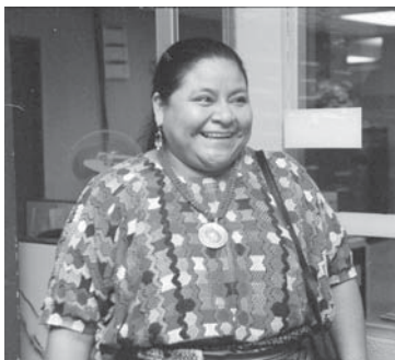
Rigoberta Menchú Tum, premio Nobel de la Paz 1992.

En marzo de 2001, la Fundación Rigoberta Menchú establecida por la premio Nobel de la Paz guatemalteca, publicó un comunicado de prensa pidiendo que: