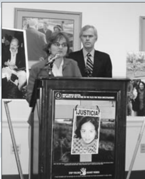
La directora ejecutiva Joy Olson, hablando en una conferencia de prensa para instar decisiones legislativas sobre el asesinato de mujeres en Ciudad Juárez y Chihuahua, México. Senador Bingaman, impulsor de la resolución del Senado, observando.