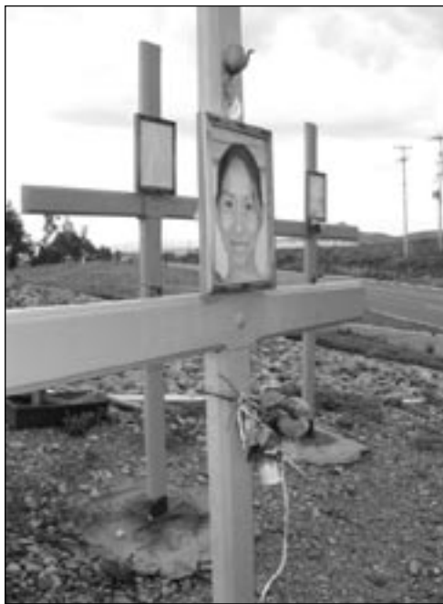
Cruces que indican la ubicación de las tumbas de las jóvenes mujeres asesinadas en Ciudad Juárez.

Por ejemplo, en un caso de 1998, los familiares de una mujer desaparecida pidieron que se haga una prueba de ADN para dilucidar si un cuerpo que había sido encontrado en las afueras de Ciudad Juárez era el de su hija. La primera prueba que se hizo resultó negativa, pero las autoridades hicieron una segunda prueba, que dio positiva. Después de enterrar los restos, y acosados por las dudas, los familiares pidieron la exhumación del cadáver y una nueva prueba de ADN. Estas dudas se intensificaron cuando comprobaron, leyendo el informe forense, que habían