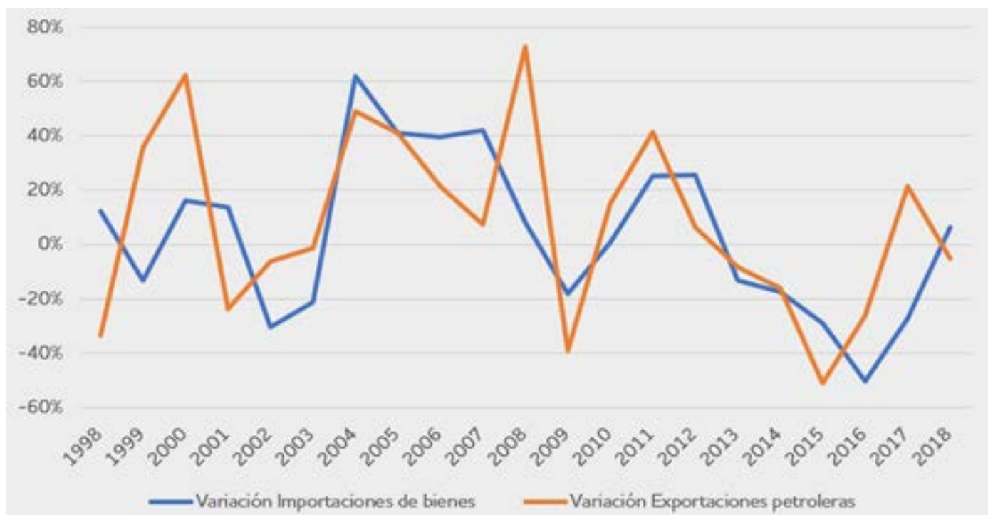
GRÁFICO #3: VARIACIÓN: % IMPORTACIONES VS. EXPORTACIONES